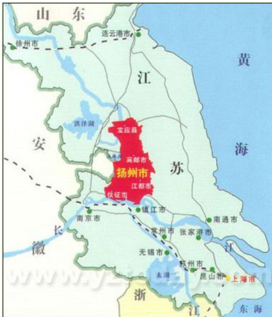
图 3-1 扬州市位置图