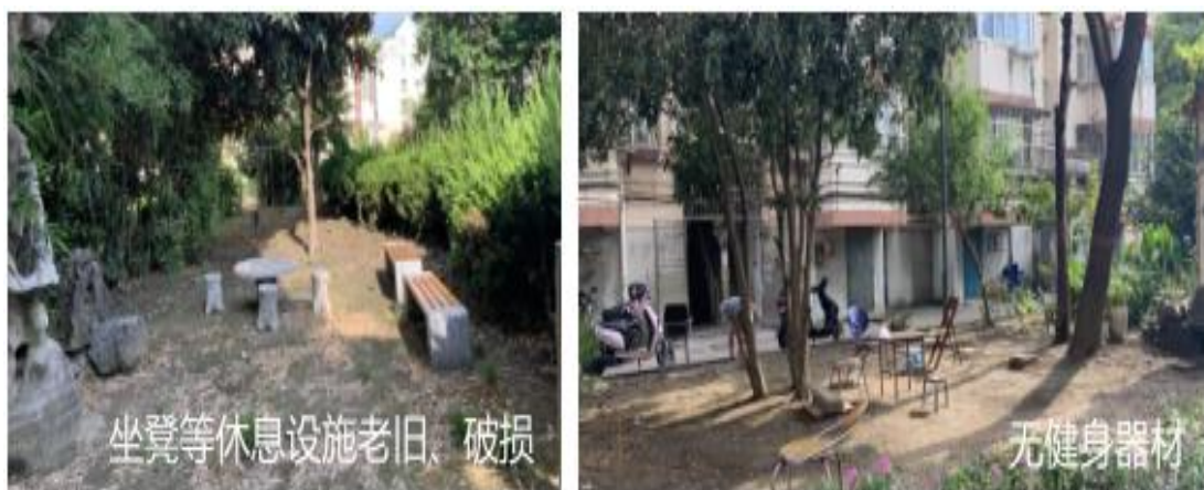
图 2-5 小区现状 5