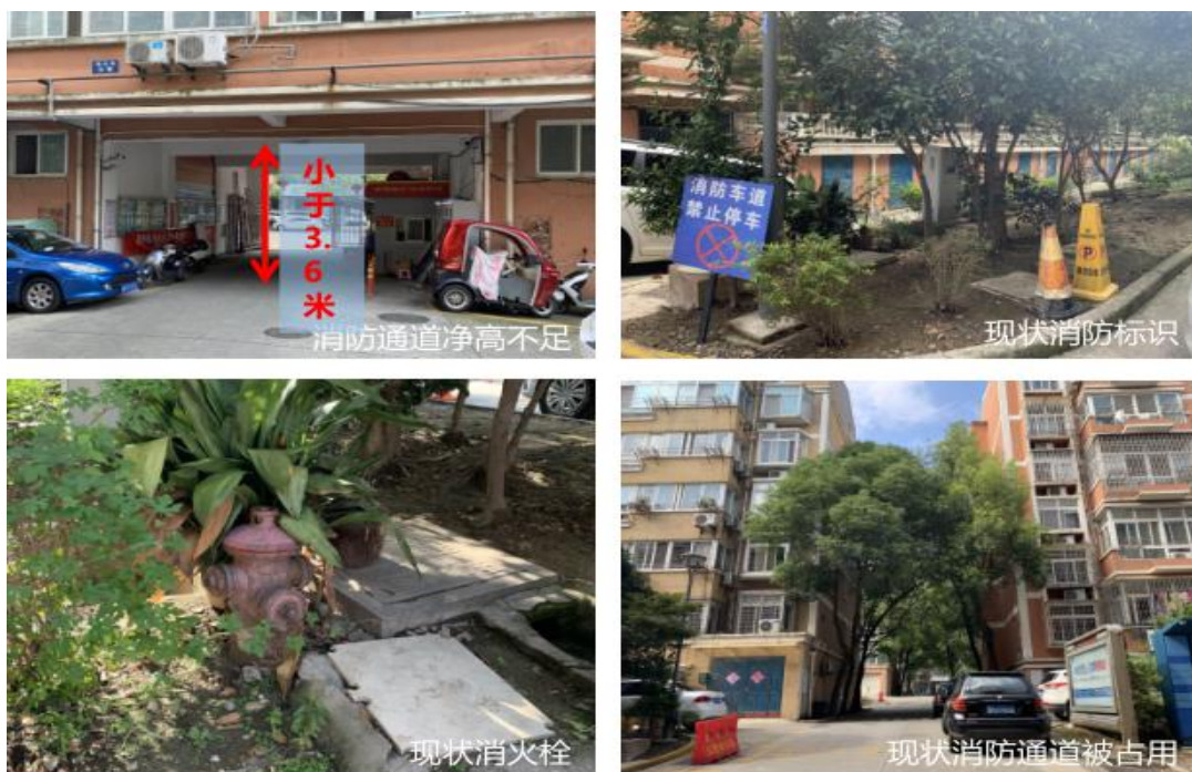
图 2-4 小区现状 4