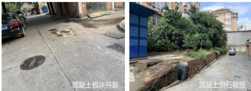
图 2-3 小区现状 3