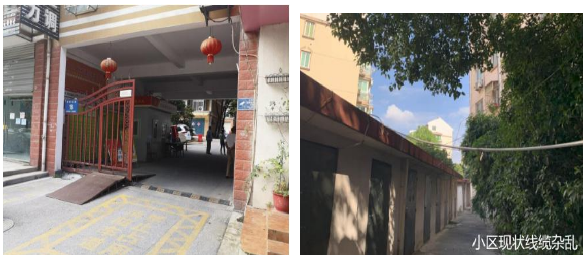
图 2-2 小区现状 2