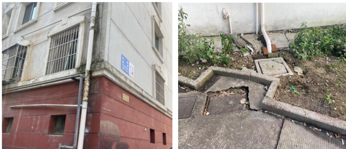
图 2-1 小区现状 1

4、便民服务设施问题：健身设施、信报箱、智能快件箱等设施不完善，休闲坐凳、宣传栏、标识牌等设施缺失。